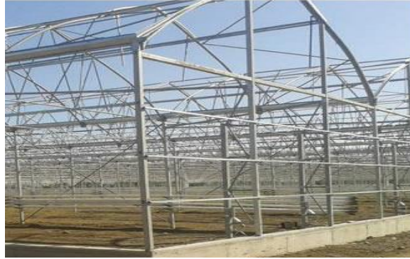
Şekil 3: Çevre Temel ve Yan Perde Betonu

Çevre Temel ve Yan Perde Betonu: Temel grov betonu 50x20 ebatlarında arazinin meyilini koruyacak şekilde sera çevresine verilen ölçülere göre yapılır. Bu beton içerisine 6 mm hasır donatı konularak betonun mukavemeti artırılır.