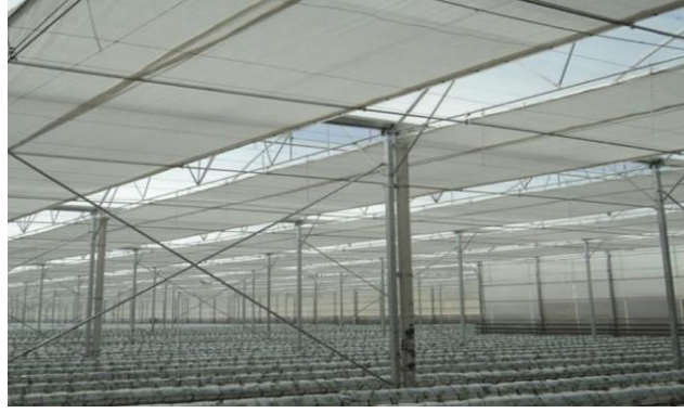
Şekil 9: Isı Perdesi Örneği

Bitki Askı Telleri: Sera içerisindeki en önemli ekipmanlardan biridir. Sağlam ve dayanıklı olmalı, kopmalara ve esnemelere karşı dirençli olmalıdır. Kopması durumunda tüm sıradaki bitkiler zarar görecektir. Tünel alınlarında, ön ve arka cepheleri boyunca 12mm'lik galvanizli halatlardan her kolona 4,5 m yükseklikte montaj yapılır. Her iç kolona sera eni yönünde 6 mm galvanizli halat bağlanır. Bu halatlar makaslara bağlanan 3 adet galvanizli zincire asılarak desteklenir. Bu halatların üzerinden her tünelde 6 sıra olmak üzere 4 mm galvanizli halat çekilerek bitki asma sistemimiz tamamlanır.