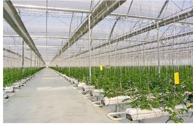
Şekil 10: Sera Askı Telleri

Bitki Askı Telleri: Sera içerisindeki en önemli ekipmanlardan biridir. Sağlam ve dayanıklı olmalı, kopmalara ve esnemelere karşı dirençli olmalıdır. Kopması durumunda tüm sıradaki bitkiler zarar görecektir. Tünel alınlarında, ön ve arka cepheleri boyunca 12mm'lik galvanizli halatlardan her kolona 4,5 m yükseklikte montaj yapılır. Her iç kolona sera eni yönünde 6 mm galvanizli halat bağlanır. Bu halatlar makaslara bağlanan 3 adet galvanizli zincire asılarak desteklenir. Bu halatların üzerinden her tünelde 6 sıra olmak üzere 4 mm galvanizli halat çekilerek bitki asma sistemimiz tamamlanır.