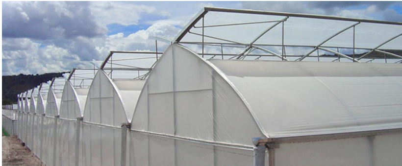
Şekil 6: Sera Havalandırma Örneği

Havalandırma Sistemi: Havalandırma sistemi her tünelde iki tane olacak şekilde konumlandırılmıştır. Havalandırmalar otomasyon ile kontrol edilecektir. Havalandırmaya sinek tülleri monte edilecektir. Sırtta bulunan motorlu havalandırma 2x250 şeklindedir ve ortalama olarak yer yüzeyinin %40'ını kaplar. Kelebek havalandırma 2.5x2 m ebadında ve açılma mesafesi de 1.5m'dir. Havalandırma 1.6 m uzunluğunda 2.5 mm kalınlığında dişli çubuklar tarafından ve pinyonlar tarafından yönlendirilir.