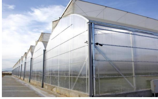
Şekil 7: Polikarbon Sera Yan Duvarları

ve galvaniz sandviç ve baskı çıtaları ile rüzgâra karşı mukavemet kazanmaktadır. Polikarbon Anti-fog, IR, Anti virüs gibi katkıları da içermektedir. Darbe dayanımı camdan 80 kat daha iyidir. Hafif ama kırılğan değildir. Su damlacıkları oluşmaz ve ışığı engellemez. Bitkisel üretim için gerekli olan ışık geçirgenliği %90'dır. Yan duvarların özellikleri genellikle, polikarbon, 8 mm çift cidarlı ve ortalama 1.450 gr/m 2 ağırlığa sahiptir.