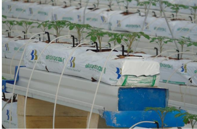
Şekil 12: Drip Sulama Sistemi

Drip Sulama Sistemi: Sulama ve gübreleme kontrol odasından Ø90/10 ve Ø 75/10 PVC anahat toprak altından 70 cm'den sera içi yürüme yolu sonuna kadar gelir. Yürüme yolunun kuzeyinde 4, güneyinde 4 olmak şartı ile toplam 8 adet 3" selenoid vana grupları oluşturulur. Her vana grubunda 3" hat üstü meç filtre ve by pass vanalar ve manometre kullanılır. Vana gruplarından sonra driper hatlarının bağlanacağı tali hatlar Ø63/6PE kangal borular olur. Driper hatları kangal borudan priz kolyeler ile çıkış alınır. Driper hatları Ø20PE 3 katmanlı dışı beyaz, içi siyah boru olacaktır. Her slab'a 4 adet (2lt/h düşme damlatıcı, 70cm spagetti boru ve ok damlatıcı) drip kullanılır. Drip hatları doğrudan güneş ışığını görmeyen, tercihen gutter'ın altında kalacak şekilde yerleştirilmelidir. Doğrudan güneş ışığı alması ve sulama suyunun sıcak yaz günlerinde ısınması, özellikle pythium, kök çürüklüğü gibi bazı hastalık etmenlerinin oluşumu için olumsuz ortam hazırlayacaktır. Sulama suyunun üretim ile ilgili sıkıntı çıkmaması için su sıcaklığının 15 0C'den daha düşük olmaması gerekmektedir.