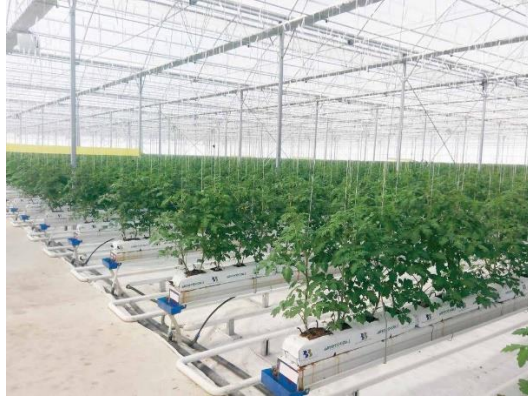
Şekil 11: Bitki Yetiştirme Yatakları

Drip Sulama Sistemi: Sulama ve gübreleme kontrol odasından Ø90/10 ve Ø 75/10 PVC anahat toprak altından 70 cm'den sera içi yürüme yolu sonuna kadar gelir. Yürüme yolunun kuzeyinde 4, güneyinde 4 olmak şartı ile toplam 8 adet 3" selenoid vana grupları oluşturulur. Her vana grubunda 3" hat üstü meç filtre ve by pass vanalar ve manometre kullanılır. Vana gruplarından sonra driper hatlarının bağlanacağı tali hatlar Ø63/6PE kangal borular olur. Driper hatları kangal borudan priz kolyeler ile çıkış alınır. Driper hatları Ø20PE 3 katmanlı dışı beyaz, içi siyah boru olacaktır. Her slab'a 4 adet (2lt/h düşme damlatıcı, 70cm spagetti boru ve ok damlatıcı) drip kullanılır. Drip hatları doğrudan güneş ışığını görmeyen, tercihen gutter'ın altında kalacak şekilde yerleştirilmelidir. Doğrudan güneş ışığı alması ve sulama suyunun sıcak yaz günlerinde ısınması, özellikle pythium, kök çürüklüğü gibi bazı hastalık etmenlerinin oluşumu için olumsuz ortam hazırlayacaktır. Sulama suyunun üretim ile ilgili sıkıntı çıkmaması için su sıcaklığının 15 0C'den daha düşük olmaması gerekmektedir.