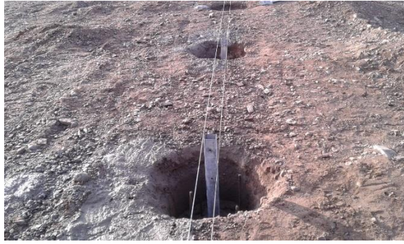
Şekil 2: Ankraj Çukuru Görseli

Çevre Temel ve Yan Perde Betonu: Temel grov betonu 50x20 ebatlarında arazinin meyilini koruyacak şekilde sera çevresine verilen ölçülere göre yapılır. Bu beton içerisine 6 mm hasır donatı konularak betonun mukavemeti artırılır.