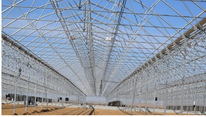
Şekil 4: Sera Gotik Tip Makas Yerleşimi Örneği

Çelik Konstrüksiyon Elemanları: Oval yay borusu, kolonlar, kolon oluk makas bağlantıları, vida ve civatalar, klipslerden oluşmaktadır. Taşıyıcı kolonlar seraların daha yüksek şekilde kurulmasını sağlar. Yüksek seralarda daha kolay iklim kontrolü sağlanırken, ihtiyaç olan gerekli yüksek havalandırma oranına ulaşılmasını sağlamaktadır. Teknik detaylar tercih edilen seraların özelliklerine göre değişmektedir.