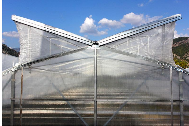
Şekil 8: Tül Örneği

Sinek Tülü: 40 mesh, 200 göz/cm 2 olup her pencerede ve havalandırmada kullanılmaktadır. Tuta Absoluta, Domates Güvesi (Kelebek), Yeşil Kurt, Prodenya, Beyaz Sinek, Galeri Sinek, Kırmızı Örümcek, Ehrips erginleri sera içine girmesini engelleyecek gözenekte olmalıdır. Bombus arılarının da sera dışına çıkmasını engeller ayrıca arı tülüne gerek yoktur. Biyolojik mücadelede kullanılan parazit ve predatörlerin sera dışına çıkışını önler.