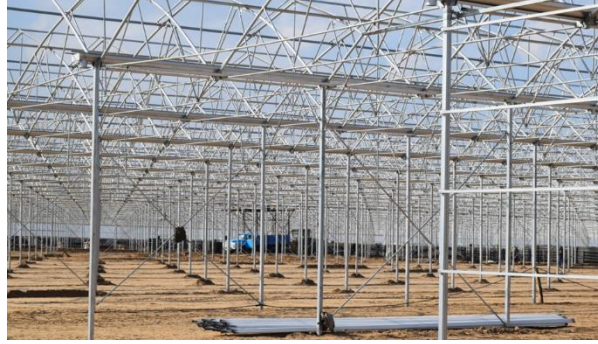
Şekil 5: Çelik Konstrüksiyon Elemanları

Çelik Konstrüksiyon Elemanları: Oval yay borusu, kolonlar, kolon oluk makas bağlantıları, vida ve civatalar, klipslerden oluşmaktadır. Taşıyıcı kolonlar seraların daha yüksek şekilde kurulmasını sağlar. Yüksek seralarda daha kolay iklim kontrolü sağlanırken, ihtiyaç olan gerekli yüksek havalandırma oranına ulaşılmasını sağlamaktadır. Teknik detaylar tercih edilen seraların özelliklerine göre değişmektedir.